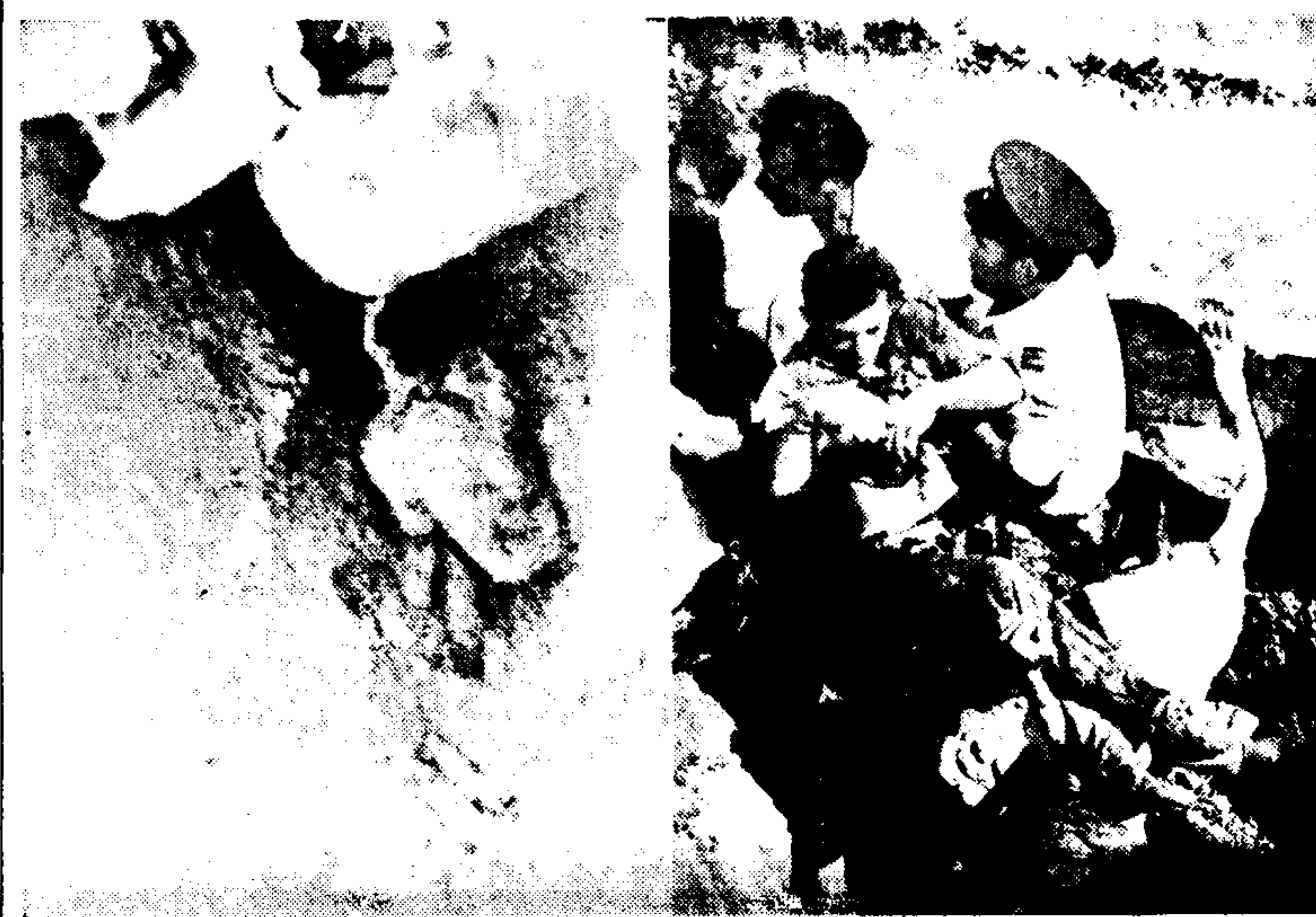
Από του Χάρου τά δόνη γύλισαν ο έργάνης Βασιλέως Σιδής, έτών 26, ο όποιος καταπλακώθηκε γύρω από όγκους χωμάτων, ένώ εργαζόταν σε τάφο αποχετεύσεως...